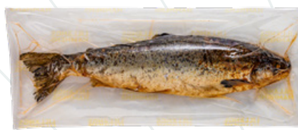
Art.nr 8800 Hel lax varmrökt (Salmo salar) Odlad Norge