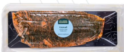
Art.nr 9533 Laxfilé gravad bufféskivad (Salmo salar) Odlad Norge FRYST