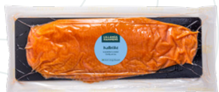
Art.nr 9534 Laxfilé kallrökt bufféskivad (Salmo salar) Odlad Norge FRYST