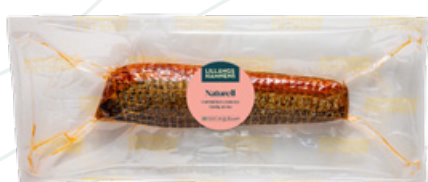
Art.nr 8711 Laxrulle varmrökt (Salmo salar) Odlad Norge