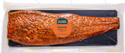
Art.nr 8502 Laxfilé varmrökt jägarmix (Salmo salar) Odlad Norge