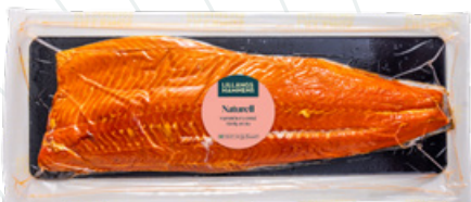
Art.nr 8503 Laxfilé varmrökt naturell (Salmo salar) Odlad Norge