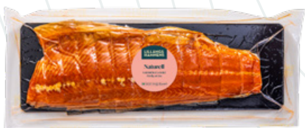
Art.nr 8523 Laxfilé varmrökt naturell portion (Salmo salar) Odlad Norge