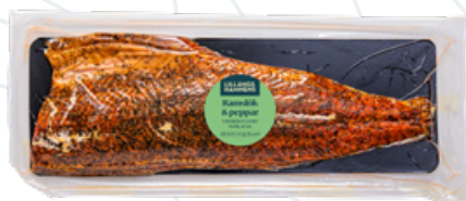
Art.nr 8507 Laxfilé varmrökt ramslök/peppar (Salmo salar) Odlad Norge