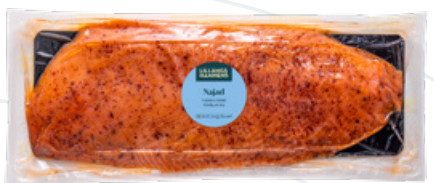
Art.nr 8532 Laxfilé najad skivad (Salmo salar) Odlad Norge