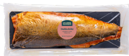
Art.nr 8510 Laxfilé varmrökt dubbel (Salmo salar) Odlad Norge