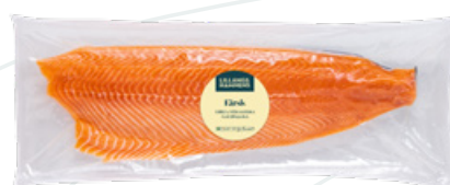
Art.nr 3300 Laxfilé IVP (Salmo salar) Odlad Norge FÄRSK

Maxa smak och kvalitet? Då är hela sidan för dig.